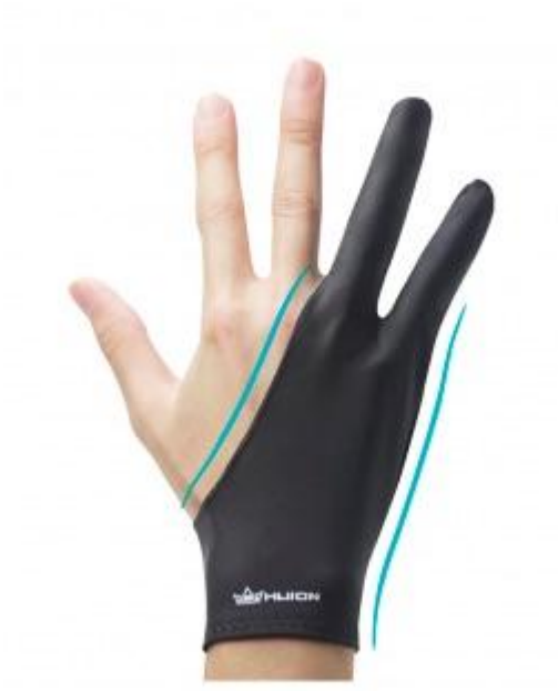
Guante Para Tableta Gráfica Huion